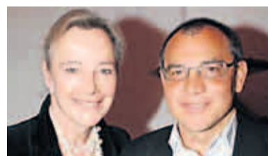
Prinzessin Uschi zu Hohenlohe, FC-Bayern-Trainer Felix Magath