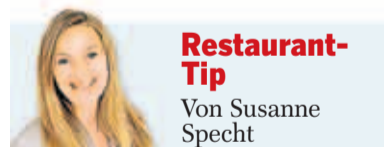
Restaurant-Tip Von Susanne Specht