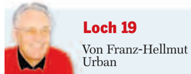
Loch 19 Von Franz-Hellmut Urban