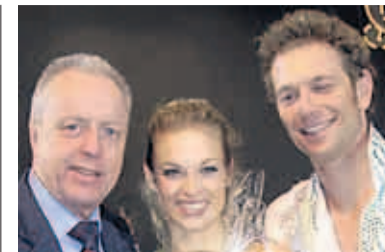
Wilfred Spronk, Kati Winkler und Rene Lohse Eisläufer Olympiasieger